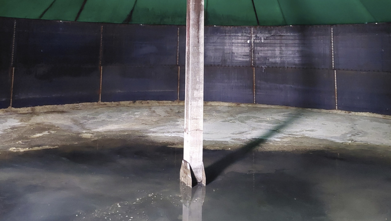
Fig. 1 : Réservoir nettoyé avant l'installation de la géomembrane