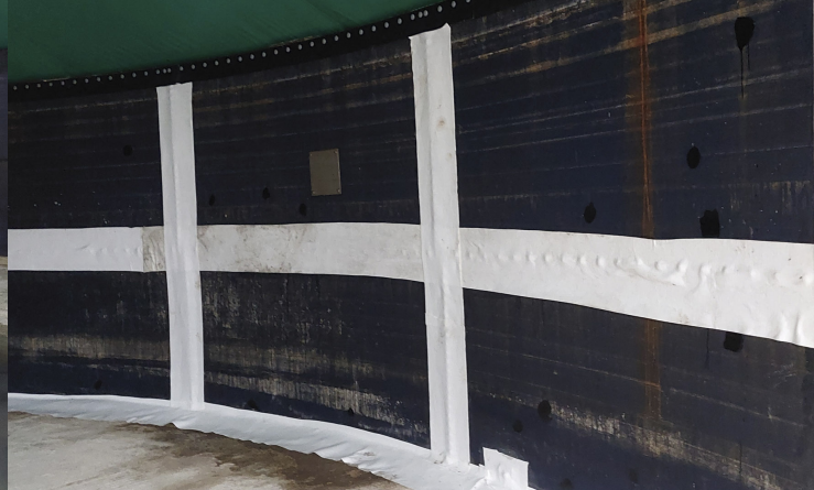
Fig. 2 : Bandes de protection Secutex® dans la zone des têtes de vis saillantes

Naue est depuis longtemps actif dans le domaine de la protection des eaux souterraines, en particulier dans l'agriculture. Les solutions innovantes et sûres de Naue garantissent, entre autres, que les substances dangereuses pour l'eau, présentes dans de nombreux domaines de la vie quotidienne et pouvant altérer la qualité des eaux souterraines ou des plans d'eau (par exemple, les détergents et produits de nettoyage, les pesticides et les engrais), ne pénètrent pas dans les eaux souterraines, les rivières ou les lacs.